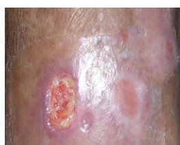
Etter at det hvite på huden er tørket bort