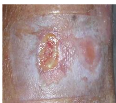
Før det hvite på huden er tørket bort

Mellom bandasjen og huden kan det oppstå en såkalla washing effect . Huden rundt såret får da en melkehvit overflate. Dette er ingen skade på huden men tørkes enkelt bort med en fuktig kompress.